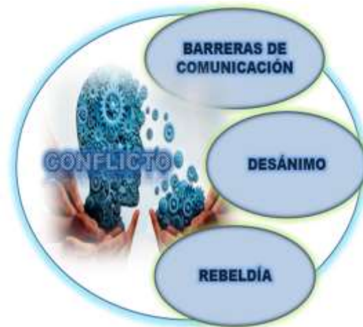
Figura. 1. El Conflicto.

mismo, para evitar se manifieste constantemente dando paso a la improductividad, desmotivación y desarmonía. Según Marín (2023), “el conflicto produce barreras en la comunicación, desánimo y rebeldía” (p.37). (Figura 1)