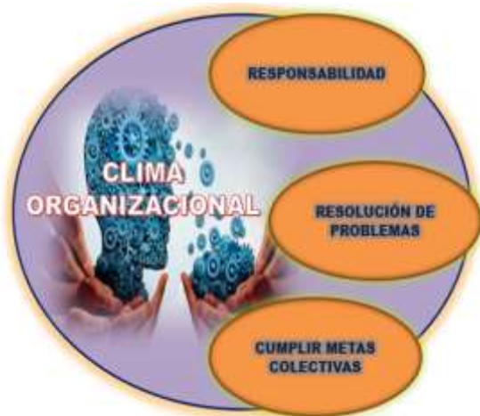
Figura. 2. Clima Organizacional

Aún hoy, no existe un consenso claro sobre el concepto de clima organizacional, porque múltiples autores han ofrecido diversas definiciones al respecto. Esta falta de acuerdo se complica aún más por la confusión que a menudo se genera al no distinguir entre clima y cultura organizacional. Una de las definiciones más acertadas describe el clima organizacional como la percepción general del personal de una organización sobre las dimensiones relevantes del clima predominantes durante un período específico. En este sentido, es fundamental resaltar, que la atención se concentra en las percepciones de