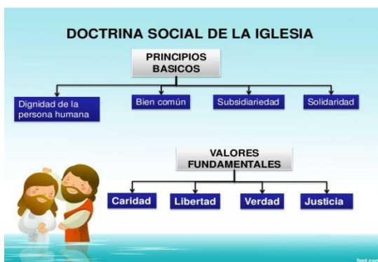
Gráfico 1. Principios básicos de la Doctrina Social de la Iglesia. Mora (2014).

promoción de los valores humanos más altos, como la verdad, la libertad, la justicia y el amor, siempre estarán detrás de los verdaderos procesos de desarrollo de los pueblos. Estos aspectos constituyen algunos de los principios de la doctrina social de la iglesia, así como también el bien común, la solidaridad, la subsidiaridad, la participación; todos ellos mencionados en la encíclica Caritas in Veritate y que de alguna manera llaman a la reflexión, pues ofrecen a todos alternativas viables para edificar una vida social buena y auténticamente renovada.