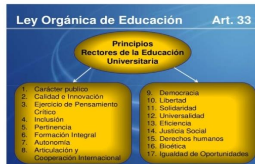
Gráfico 2. Principios Rectores de la Educación Universitaria. Arias (2011).

de una comunidad que necesita volver al rescate de los mismos.