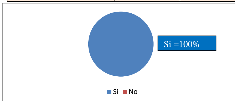
Gráfico 3. Representación gráfica de la opinión de los encuestados sobre la dimensión: Uso de la danza. Ítems 8, 9, 10, 11, 12 y 13.

Resulta obvio, que la totalidad de los encuestados cien por ciento