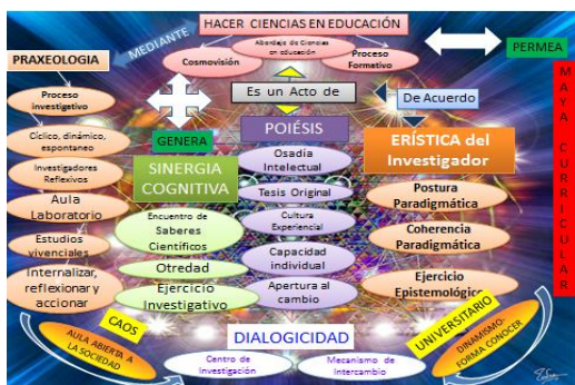
Figura no lineal 2 Proyección Transcendental de la Conciencia Constitutiva de un todo en las Categorías Esenciales Universales. Estructura General. Suárez (2017).

El significado funcional de la estructura general, prueba entender sobre la relación de las categorías no en términos aislados, una relación con el todo en este sentido hacer ciencias en educación es un acto de poiésis desde la osadía intelectual caracterizada por la apertura al cambio, cultura experiencial y capacidad individual de cada doctorando donde emerge una tesis original todo esto mediante la praxeología entendida como un proceso investigativo práxico, dinámico, en la aproximación a la realidad está implícita una internalización, reflexión y accionar de la práctica de investigación en una