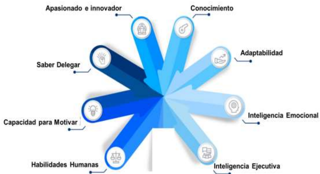
Figura 1. Perfil del gerente del Cambio.

tienen que ver con la apropiada administración de los recursos económicos y el cumplir fielmente con la normativa, sino también con ciertas gestiones gerenciales que lo conducen a tener las siguientes capacidades que se observan en la figura1: