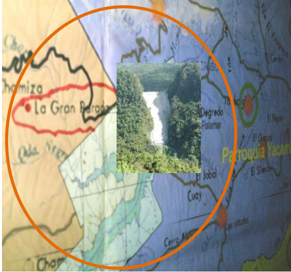
Figura 1. Ubicación relativa de comunidad La Gran Parada, las obras de regulación y trasvase del embalse Yacambú.

expropiación como se muestra en la figura 1.